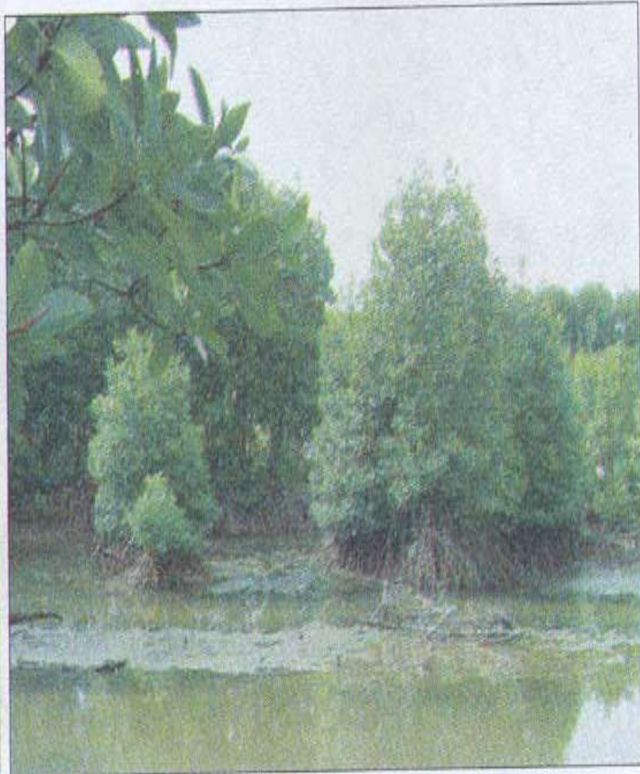
CẢNH RỪNG ĐUỐC