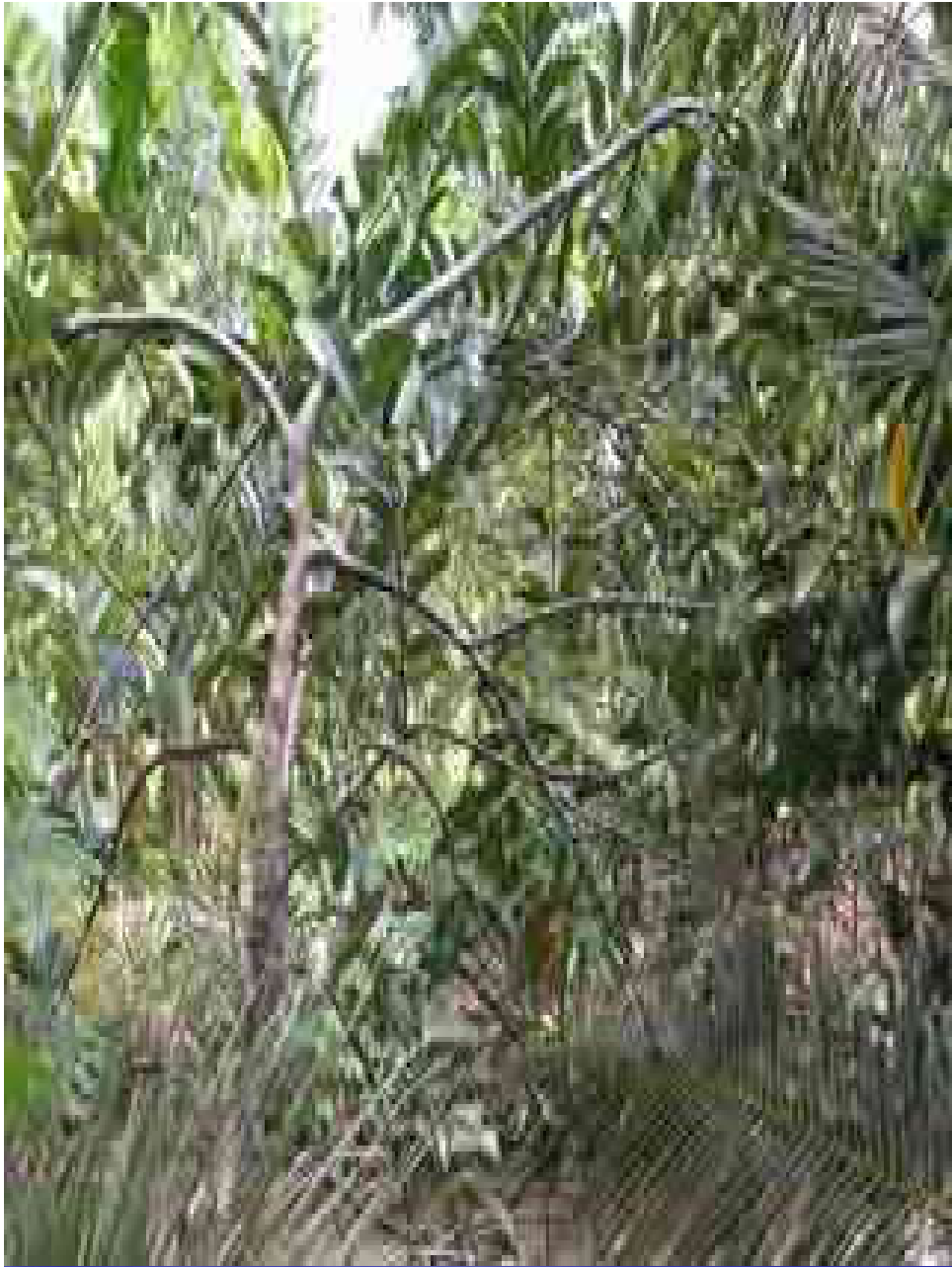
CÂY BÌNH BÁT