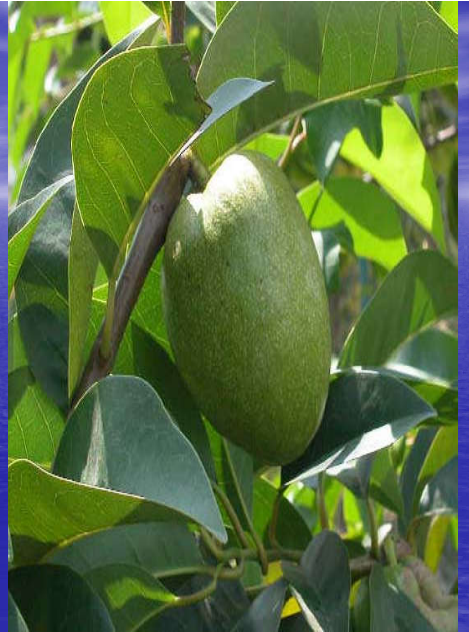
QUẢ BÌNH BÁT