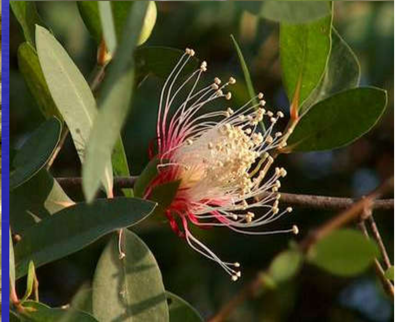
NU, HOA CÂY BÀN