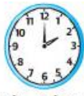
Đồng hồ B