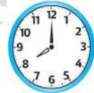
Đồng hồ D