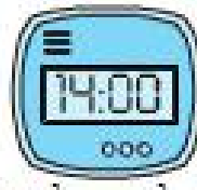
Đồng hồ C