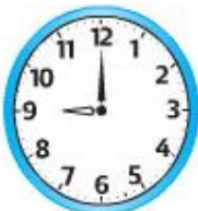
Đồng hồ A